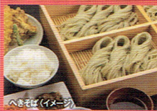
へきそば(イメージ)