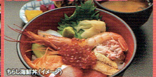
ちらし海鮮丼(イメージ)