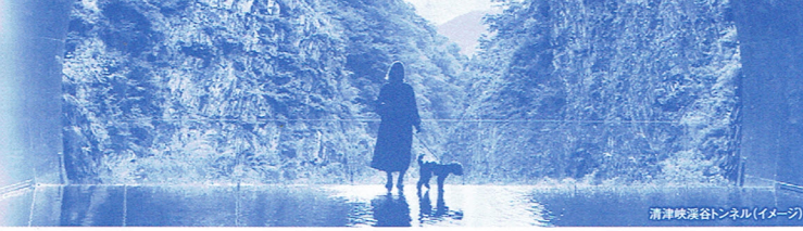
清津峡深谷トンネル(イメージ)