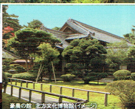
豪農の館 北方文化博物館(イメージ)