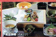
東忠御膳(イメージ)