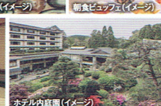
ホテル内庭園(イメージ)