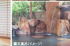
露天風呂(イメージ)