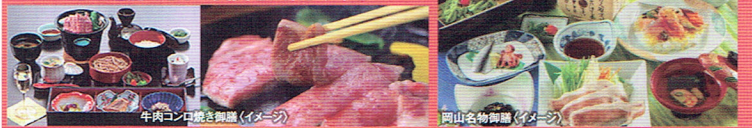
牛肉コンロ焼き御膳(イメージ)

「牛肉コンロ焼き御膳」や「岡山名物御膳」など、 ここでしか堪能できない美食をお楽しみ下さい!