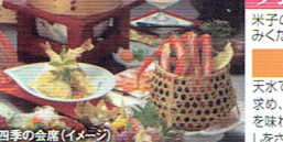
四季の会席(イメージ)

夕食 会席料理 米子の旬を楽しむ、四季替りの会席料理をお楽し みください。※提供内容が変更になる場合がございます。