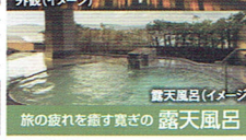
露天風呂(イメージ)