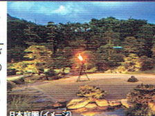
日本庭園(イメージ)

館内には出雲神話をモチーフにした演出が 見られ、旅情緒を誘います。当地最大級の 広さを誇る大浴場や夕暮時に篝(かがり) 火を灯す幻想的な日本庭園が自慢です。 TVドラマやアニメの舞台にもなりました。