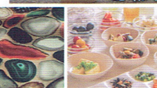
朝食ビュッフェ(イメージ)